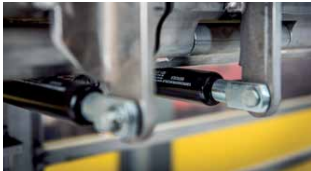
Lichte bediening van de klapvloerdelen door gasveer ondersteuning.