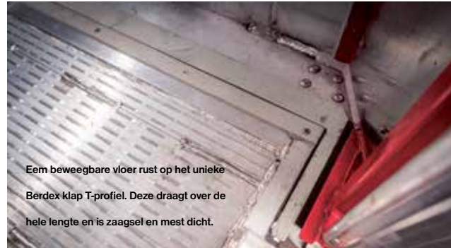
Een beweegbare vloer rust op het unieke Berdex klap T-profiel. Deze draagt over de hele lengte en is zaagsel en mest dicht.

Berdex wagens worden voorzien van één van de beproefde vloer systemen of een combinatie daarvan. Al onze oplossingen sluiten over de hele lengte goed af en zijn zaagsel en mest dicht. Uiteraard zijn al onze vloeren makkelijk te bedienen.