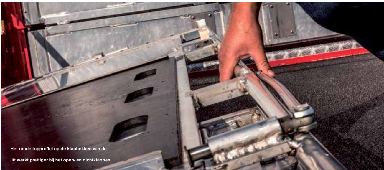
Het ronde topprofiel op de klaphekken van de lift werkt prettiger bij het open- en dichtklappen.