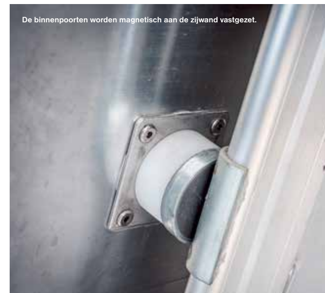
De binnenpoorten worden magnetisch aan de zijwand vastgezet.

De degelijkheid van een Berdex trailer gaat verder dan de materiaaleigenschappen. Onze jarenlange ervaring en feedback uit de praktijk hebben bijgedragen aan de doorontwikkeling van alle aspecten van onze trailers. Ze gaan niet alleen lang mee maar voelen ook degelijk en prettig aan in het gebruik.