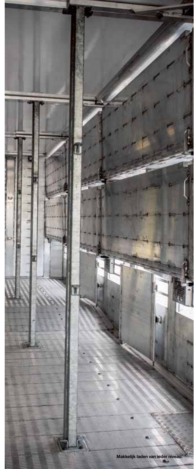
Makkelijk laden van ieder niveau.