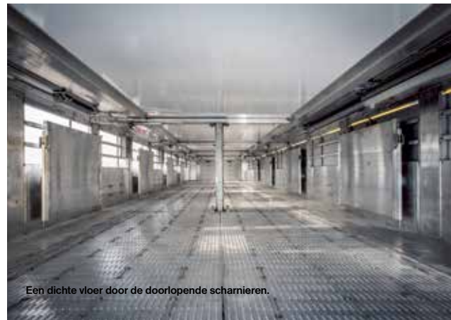
Een dichte vloer door de doorlopende scharnieren.