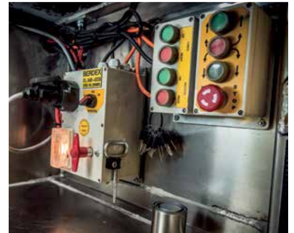
Vaste knoppenkast in kist inclusief noodstop.