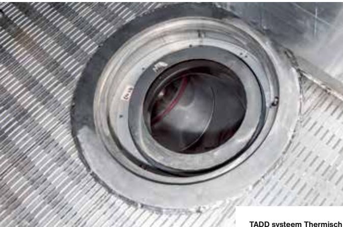
TADD systeem Thermisch reinigen van het voertuig.