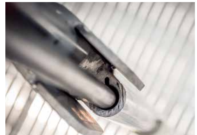
De binnenpoorten hebben een rond scharnier profiel en afgeronde zijkanten om verwondingen te voorkomen. De ruimte voor de stalen sluitpen heeft een blinde afwatering. Om ook bij vorst een goede werking te garanderen.