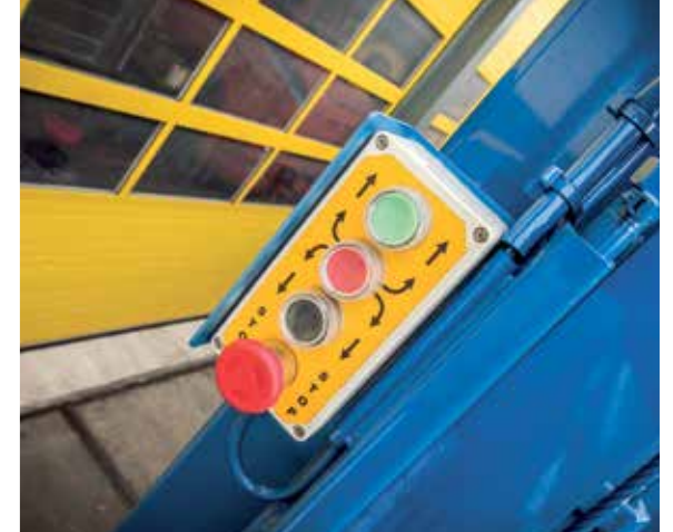
Meegaande knoppenkast op glijer links inclusief noodstop.